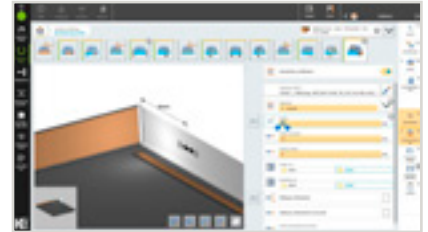
Bei Anwahl des Parameters wird die Bemaßung am Werkstück angezeigt.