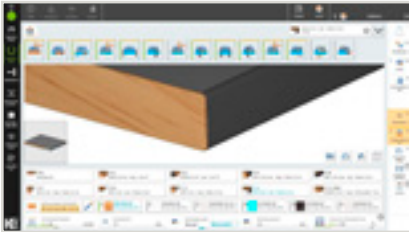
Mit wenigen Klicks zum Werkstück-Programm.