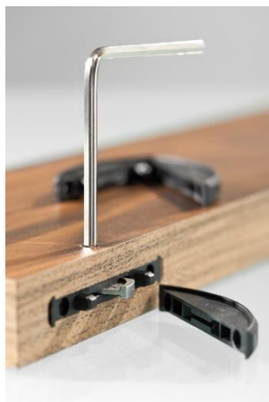
Zdjęcie 2: Zdjęcie 2: Nowością w maszynie DRILLTEQ V-200 jest złączka Clamex P do produkcji korpusów.