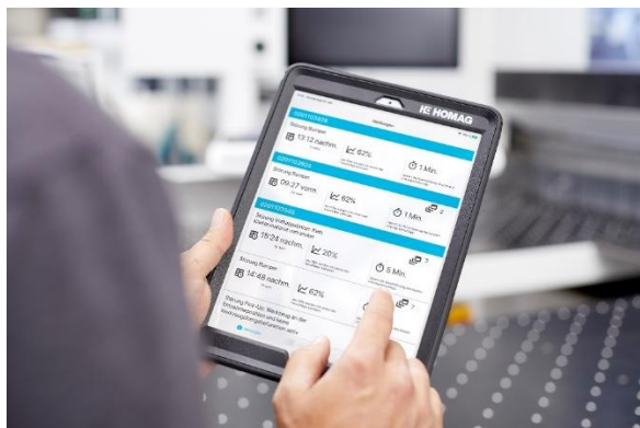
Zdjęcie 12: ServiceAsst: Aplikacja, która pomaga w rozwiązywaniu problemów.