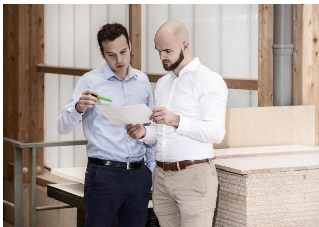
Zdjęcie 13: Specjaliści firmy HOMAG wspólnie z klientami analizują i opracowują rozwiązania, które przyniosą im wymierną korzyść.