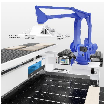
Zdjęcie 7: Pilarka z robotem SAWTEQ B-300 flexTec. Pilarkę można obsługiwać ręcznie, ale jest także możliwość przeprowadzenia w pełni automatycznego rozkroju pojedynczych elementów za pomocą robota.