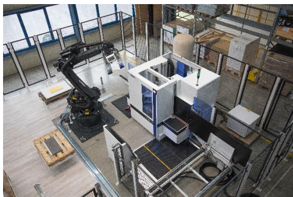
Zdjęcie 1: DRILLTEQ V-500 i FEEDBOT D-300 to zgrany duet, który gwarantuje wydajną produkcję.