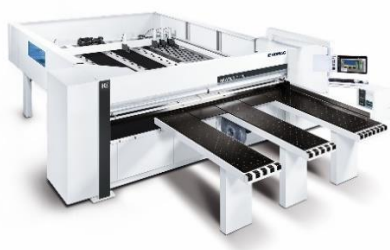
Zdjęcie 6: Zdjęcie 6: Pilarka SAWTEQ B-130 -dostępna jest także opcjonalnie z długością cięcia 3800 mm.