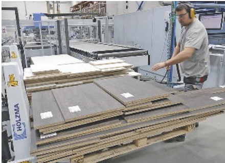
Einmal auflegen reicht: das Beschicken der Bekantungszelle