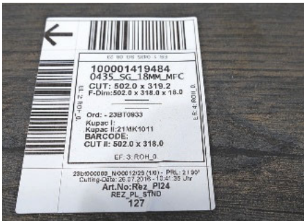
Der Pfeil gehört in Laufrichtung