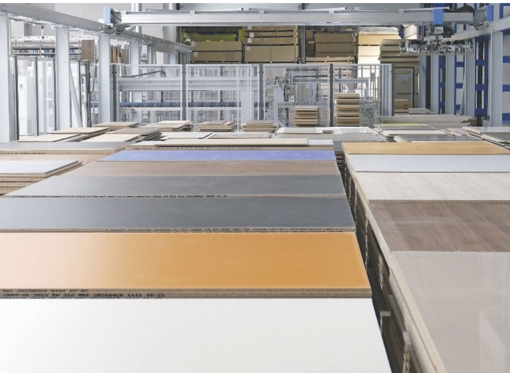
Das Lager bietet den direkten Zugriff auf 250 Dekore aus dem Egger-Programm