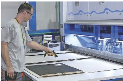
Über den Scanner läuft der Check was hineingehört und ob noch etwas fehlt