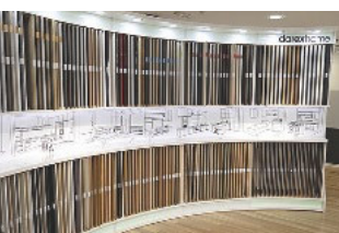
Große Vielfalt: Plattenmuster in der Ausstellung von Darex Home

Fehlt beim Kunden nur ein Scharnier oder eine Blende, so hat der Möbelhersteller mit dem Auftrag Geld verbrannt statt verdient. Darex Home in Belgrad vertreibt Küchen online, liefert innerhalb von 48 Stunden, arbeitet vollvernetzt und stellt sicher, dass keiner etwas vergisst.