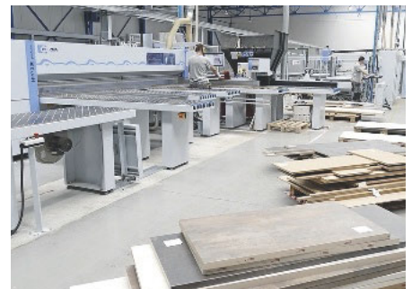
Nach Kantenfarbe sortierte Stapel