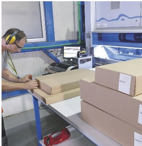
... und am Schluss noch ein Etikett mit Kunden- namen, -kommission und Artikelbeschreibung