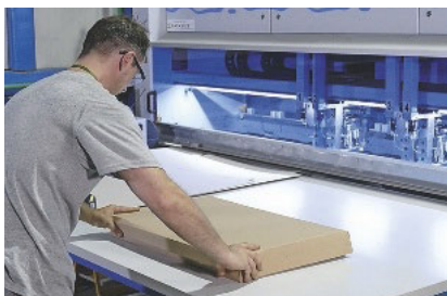
Ein Schrank ein Karton ...