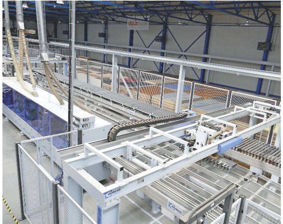
Vorne die Bekantungszelle, dahinter das Lager