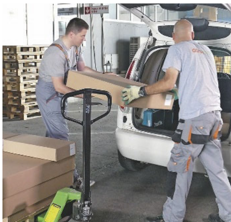
Ein Schreiner holt seine Bestellung selbst ab

ein anderer Kollege die mit den Möbelteilen zu verpackenden Möbelbeschläge. Auch hierbei organisiert WoodFactory den Workflow und stellt mit einem Barcodescanner die Wahl der korrekten Beschläge in exakt der geforderten Stückzahl sicher, nur dann gibt das Leitsystem grünes Licht.