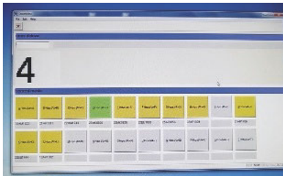
Grünes Licht für Stapel 4: vollständig und bereit zum Verpacken